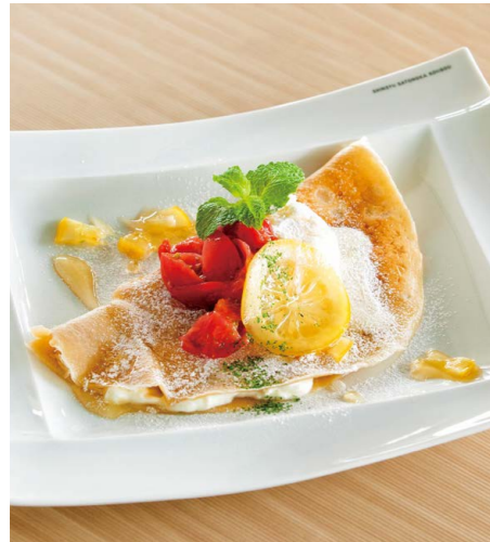
そば粉のレアチーズガレット - トマトとはちみつレモン -