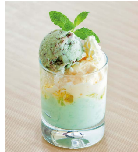
チョコミントプチパルフェ