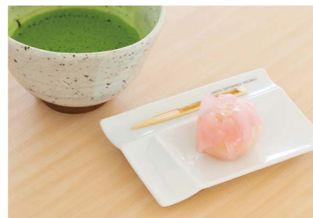
お抹茶セット - 上生菓子と抹茶 -