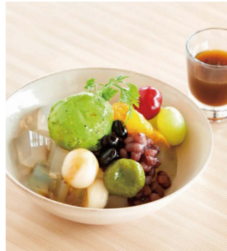
ミントとプレーン寒天の 抹茶クリームあんみつ

パニラアイス、生クリーム、スポンジ、 レアチーズクリーム、グラハムクッキー、 季節のフルーツ、いちごコンフィ、ミント