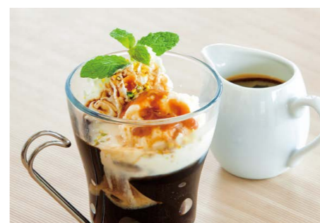
キャラメルCAFEバニラ