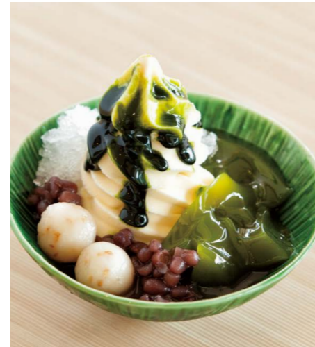
抹茶ゼリーの 冷やしぜんざい

抹茶アイス、ミント寒天、プレーン寒天、 抹茶白玉、白玉、つぶあん、黒豆、 季節のフルーツ、黒みつ