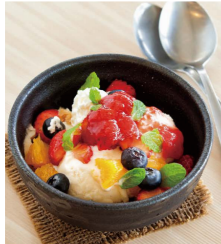
コールドストーン風 まぜるアイスパフェ

パニラアイス、レアチーズクリーム、 シロップ漬トマト、はちみつレモン、 はちみつ