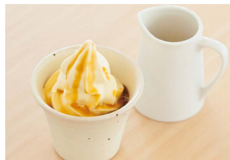
栗のソフトエスプレッソがけ