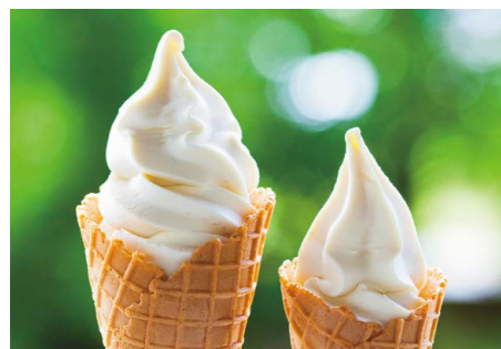
栗のソフトクリーム